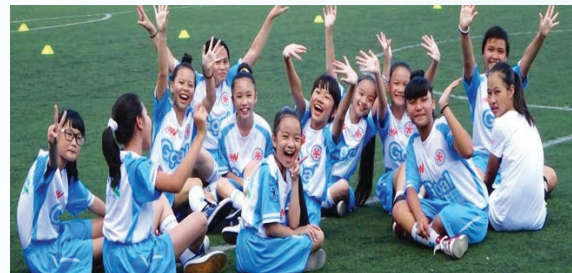
Young female students join a sporting event support by Standard Chartered Vietnam under the lender's education program Goal, which is meant to equip girls with financial education, life skills, and work training