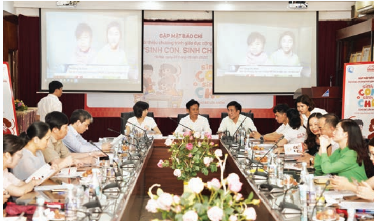
Reporters at the launch of the community program “Sinh con, Sinh cha” in the northern province of Bac Giang in late June, 2020