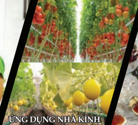
ỨNG DỤNG NHÀ KÍNH