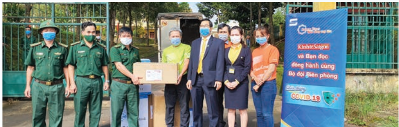
Nam A Bank joins hands with the Saigon Times Group to donate face masks and hand sanitizers to the Dong Thap Border Guard