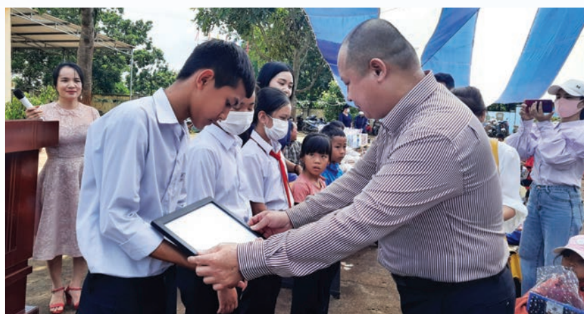
Đại diện Home Credit Việt Nam trao chứng nhận học bổng cho học sinh khó khăn có thành tích học tập tốt tại tỉnh Đắk Lắk

Trên hành trình hiện thực hoá triết lý kinh doanh gắn liền với trách nhiệm xã hội, nâng cao đời sống người dân Việt Nam, Home Credit Việt Nam đã tạo nên những giá trị tích cực cho chính công ty và cộng đồng thông qua những hoạt động Trách nhiệm cộng đồng của doanh nghiệp.