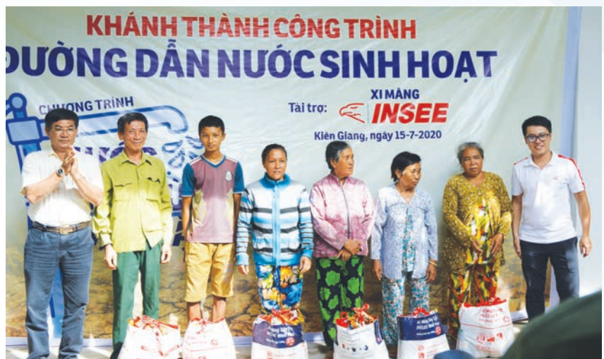
Tại lễ khánh thành đường ống dẫn nước, Ban tổ chức cũng đã trao tặng 20 phần quà cho các hộ dân có điều kiện khó khăn trong khu vực.

Công trình đường ống nước không chỉ có ý nghĩa đặc biệt đối với địa phương, nhằm nâng cao sức khỏe và chất lượng cuộc sống, mà còn góp phần tạo điều