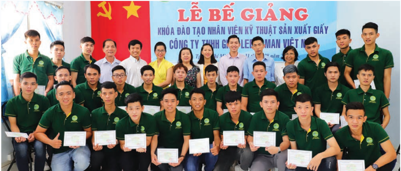
Các sinh viên sau khi ra trường sẽ được nhận vào làm tại Lee & Man với thu nhập ổn định khởi điểm 6-7 triệu đồng/tháng

Trong bối cảnh hội nhập sâu rộng, yêu cầu đặt ra đối với doanh nghiệp là thực thi tốt mô hình phát triển bền vững (PTBV). Bên cạnh mục tiêu thúc đẩy kinh tế, xã hội và môi trường, trách nhiệm xã hội cũng là yếu tố cần được chú trọng hơn hết, góp phần thể hiện cam kết của doanh nghiệp trong sự phát triển kinh tế bền vững, nâng cao chất lượng cuộc sống cho người lao động và gia đình họ, cộng đồng địa phương và xã hội nói chung.