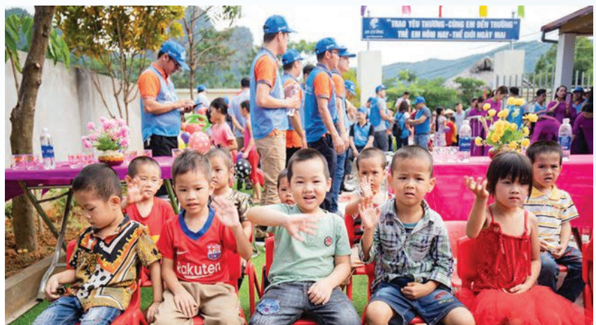
Children pose for a group photo in a charity program held by An Cuong

With an aim to help underprivileged students living in remote, mountainous regions earn knowledge, An Cuong decided to present more than 100 gift sets to students of Lung Ga school in