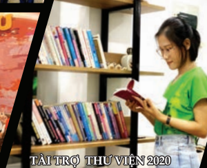
TÀI TRỢ THƯ VIỆN 2020