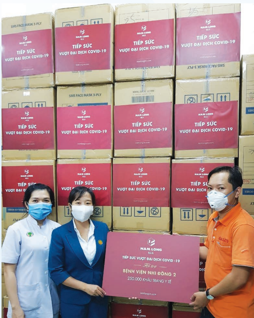
Nam Long trao tặng Bệnh viện Nhi Đồng 2 275.000 khẩu trang y tế, Bệnh viện Bệnh Nhiệt đới 24.000 khẩu trang N95, Trung tâm Y tế huyện Cần Giò 125.000 khẩu trang y tế và 1000 chai dung dịch sát khuẩn.

Chiến dịch “Nam Long tiếp sức vượt đại dịch Covid-19” là chương trình trách nhiệm xã hội được Tập đoàn Nam Long triển khai trong giai đoạn tái bùng phát của Covid-19, với tổng giá trị tài trợ hơn 05 tỉ đồng để hỗ trợ nhiều mặt trận chống dịch trên cả nước và những cộng đồng trực tiếp bị ảnh hưởng bởi dịch bệnh.