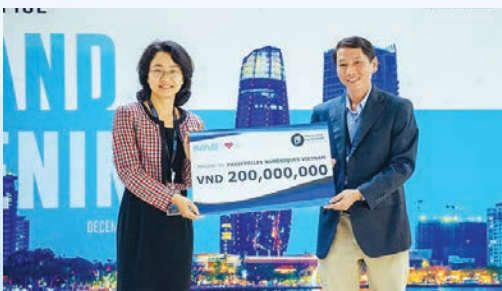
KMS Technology donates VND200 million to Passerelles numériques Vietnam to support underprivileged IT students