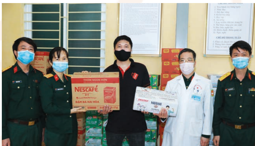
A Nestlé representative hands over Nestlé products to assist with the fight against Covid-19 at the Military Hospital 103

With “Creating Shared Value” as its core business practice, Nestlé Vietnam has managed to weather the storm of Covid-19, an unprecedented public health crisis that has upended all aspects of life in many parts of the world including Vietnam, while keeping its efforts to contribute positive values to consumers, farmers, shareholders as well as its business partners in Vietnam.