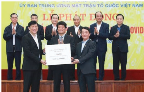
A representative of Thaco hands VND10 billion to the national fund on Covid-19 prevention and control