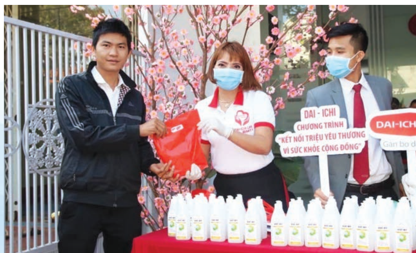
Dai-ichi Life Việt Nam tặng khẩu trang và dung dịch rửa tay sát khuẩn cho người dân.

Mong muốn tiếp sức đến trường cho các em nhỏ - những mầm non tương lai của đất nước, Dai-ichi Life Việt Nam đã hỗ trợ hơn 2 tỷ đồng bao gồm học bổng và quà tặng cho trẻ em nghèo hiếu học. Quan tâm đến cải thiện môi trường học tập của các em, Quỹ Vì cuộc sống tươi đẹp đã bàn giao công trình “Nước sạch và Nhà vệ sinh học đường” trị giá hơn 380 triệu đồng cho trường Tiểu học Nguyễn Văn Trỗi, thuộc huyện Thăng Bình, tỉnh Quảng Nam. Đây là công trình thứ 24 thuộc dự án Nước sạch và Nhà vệ sinh học đường với tổng ngân sách hơn 3,5 tỷ đồng, do Dai-ichi Life Việt Nam triển khai trên toàn quốc nhằm chào mừng mốc son vinh dự phục vụ 3 triệu khách hàng, giúp mang đến nguồn nước sạch cho trường học tại các vùng nông thôn.