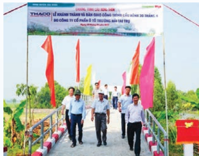
A bridge sponsored by Thaco is put into operation