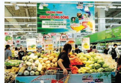
Vegetables grown under the Community Livelihoods program are sold at a Big C supermarket