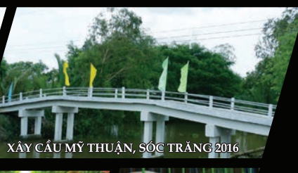
XÂY CẦU MỸ THUẬN, SÓC TRĂNG 2016