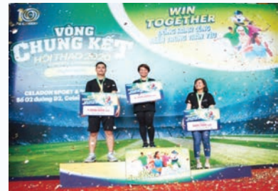
Three winners of the "I run-We win" virtual running event held by FE Credit for the 21-kilometer distance pose for a photo