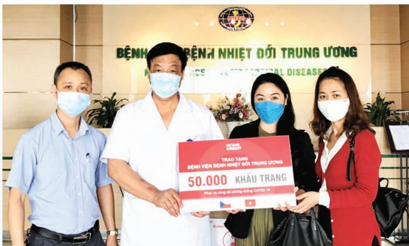
Home Credit Vietnam and the National Hospital for Tropical Disease in Hanoi representatives pose for group photo at a mask donation handover ceremony

Since its early operations in Vietnam, Home Credit Vietnam has rolled out a number of activities to improve financial literacy as well as to promote responsible lending and borrowing; to educate