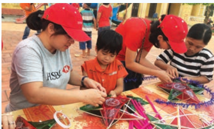
HSBC employees help kids make lanterns in a community program

R ecognizing one of the disadvantages of Vietnamese students is how to apply academic knowledge into reality as well as how to use soft skills for success, HSBC has introduced the HSBC/HKU Asia Pacific Business Case Competition to Vietnam. Via the competition, the bank seeks to equip students with employability skills, help them experience the international working environment and challenges, and preparing themselves for future working life.