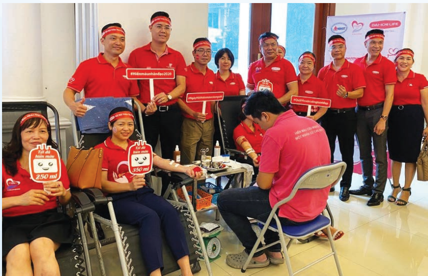
Dai-ichi Life Vietnam employees join a blood donation in Bac Ninh Province

Loyal to the humane philosophy “Thinking people first,” Dai-ichi Life Vietnam, one of the leading life insurers in the country, has put social responsibilities on the front burner, apart from its business activities over the past 13 years. With the commitment to bringing great values to the community, the life insurer is relentlessly initiating a variety of community programs, spending over VND42 billion on practical activities.