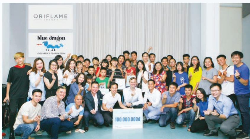
Đoàn Oriflame cùng Đại sứ Thương hiệu - H'Hen Niê trong chuyến thăm các em thiếu niên tại Trung tâm giải cứu trẻ em đường phố Blue Dragon vào tháng 7/2019

Dịch Covid-19 bùng phát trở lại và lây lan nhanh trong thời gian ngắn tại nhiều tỉnh thành, trong đó Đà Nẵng là địa phương có số ca mắc mới và nguy cơ lây lan trên diện rộng cao. Đồng lòng với người dân trên cả nước chung tay đẩy lùi Covid-19, ngày 3/9 vừa qua, Oriflame đã ủng hộ hơn 100 triệu đồng cho Quỹ hỗ trợ cung ứng Vật tư y tế cho các Y Bác sĩ đang trực tiếp chiến đấu với Covid 19 tại Đà Nẵng.