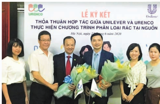
Representatives of Unilever Vietnam and URENCO pose for a photo after signing an agreement to conduct a waste segregation at source program in Hanoi in June