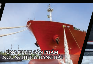
ỨNG DỤNG SẢN PHẨM NGƯ NGHIỆP & HÀNG HẢI