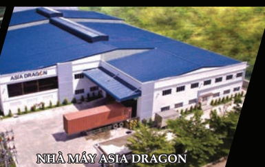
NHÀ MÁY ASIA DRAGON