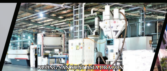
XUẤT SẢN XUẤT ASIA DRAGON