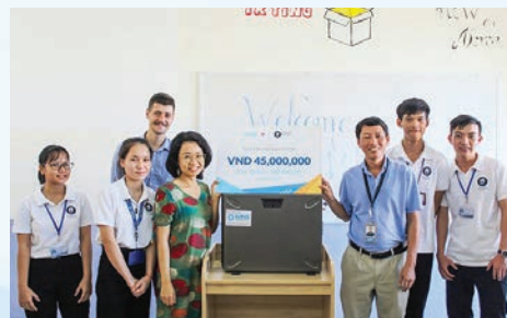
KMS Technology donates a VND45-million server to Passerelles numériques Vietnam