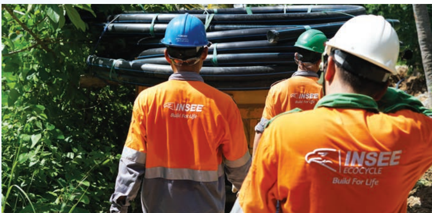
INSEE Vietnam installs water pipelines for Ba Nui Hamlet in Binh An Commune of Kien Luong District, Kien Giang Province

INSEE Vietnam on July 15 joined forces with Tuoi Tre News and Kien Giang Youth Union to organize a ceremony marking the inauguration of a 1.6km-long water pipeline in Ba Nui Hamlet in Binh An Commune of Kien Giang Province's Kien Luong District with a sponsorship of around VND250 million.