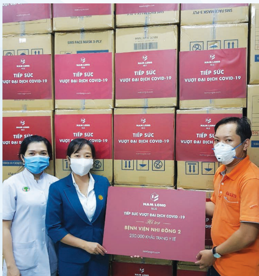
Nam Long Group donates face masks to Children's Hospital 2 in HCMC

The coronavirus pandemic has been brought under control in Vietnam with no new local transmissions reported for over two months, and the success is attributed to many stakeholders, especially the Government's stringent control, efforts by the medical sector as frontliners, and border guards tightening immigration control among others. In such a fight, contributions from the business circle have also played a vital part, and Nam Long Group is one among active supporters.