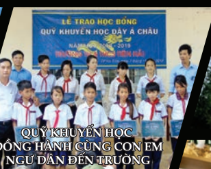
QUỸ KHUYẾN HỌC ĐỒNG HÀNH CÙNG CON EM NGƯỜI DẪN ĐEN TRƯỜNG