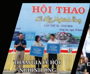
THAM GIA LỄ HỘI NGHINH ÔNG