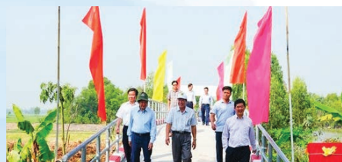
A bridge sponsored by Thaco is put into operation