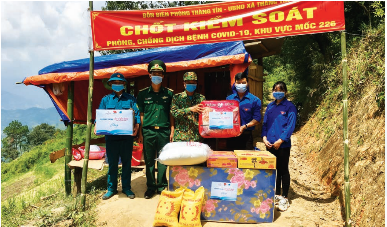
Nam Long trao vật phẩm hỗ trợ cho 5 chốt đồn biên phòng Thành Tín (Hà Giang).