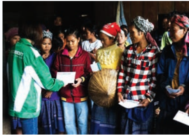
A representative of FE Credit presents gifts to flood-hit residents in the central region

Sharing difficulties with the community and supporting disadvantaged people, FE Credit has engaged in numerous corporate social responsibility (CSR) activities in various fields such as society, education and environment for many years in an effort to improve the living standards of poor residents nationwide. In its community programs, the consumer finance company has always managed to shift its support to areas where the residents are in dire need. As such, victims of recent natural disasters in Central Vietnam have been caught in the company's social radar.