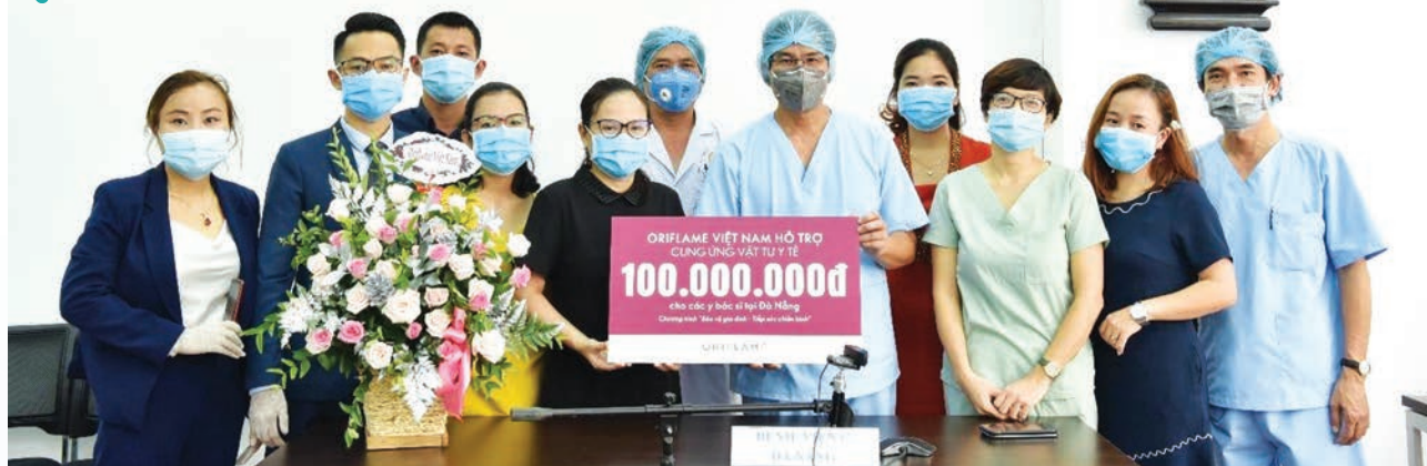
Representatives of Danang C Hospital receive a token cheque worth VND100 million from Oriflame Vietnam in the “Protect your family – Support Covid-19 fighters” campaign, which ran from August 6 to 28