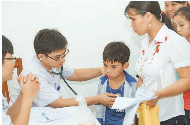
A doctor examines children for free heart operations under the Viettel-sponsored Heart for Children program