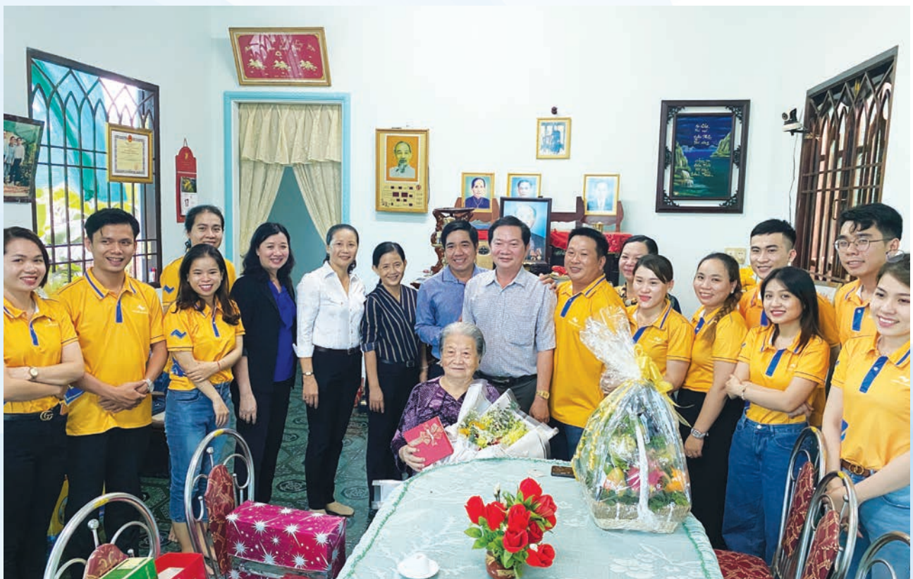
Hoạt động đến thăm Mẹ Việt Nam anh hùng của team Kỳ Lân tiên phong.

Vừa qua, nhân dịp kỉ niệm 10 năm thành lập, Thắng Lợi Group đã tổ chức các hoạt động CSR trong khuôn khổ chương trình “Trái tim người Thắng Lợi” tại địa bàn tỉnh Long An. Đây là một trong hoạt động thường niên được Ban lãnh đạo công ty đặc biệt chú trọng nhằm chia sẻ, giúp đỡ các cá nhân, tổ chức có hoàn cảnh khó khăn trên phạm vi cả nước.