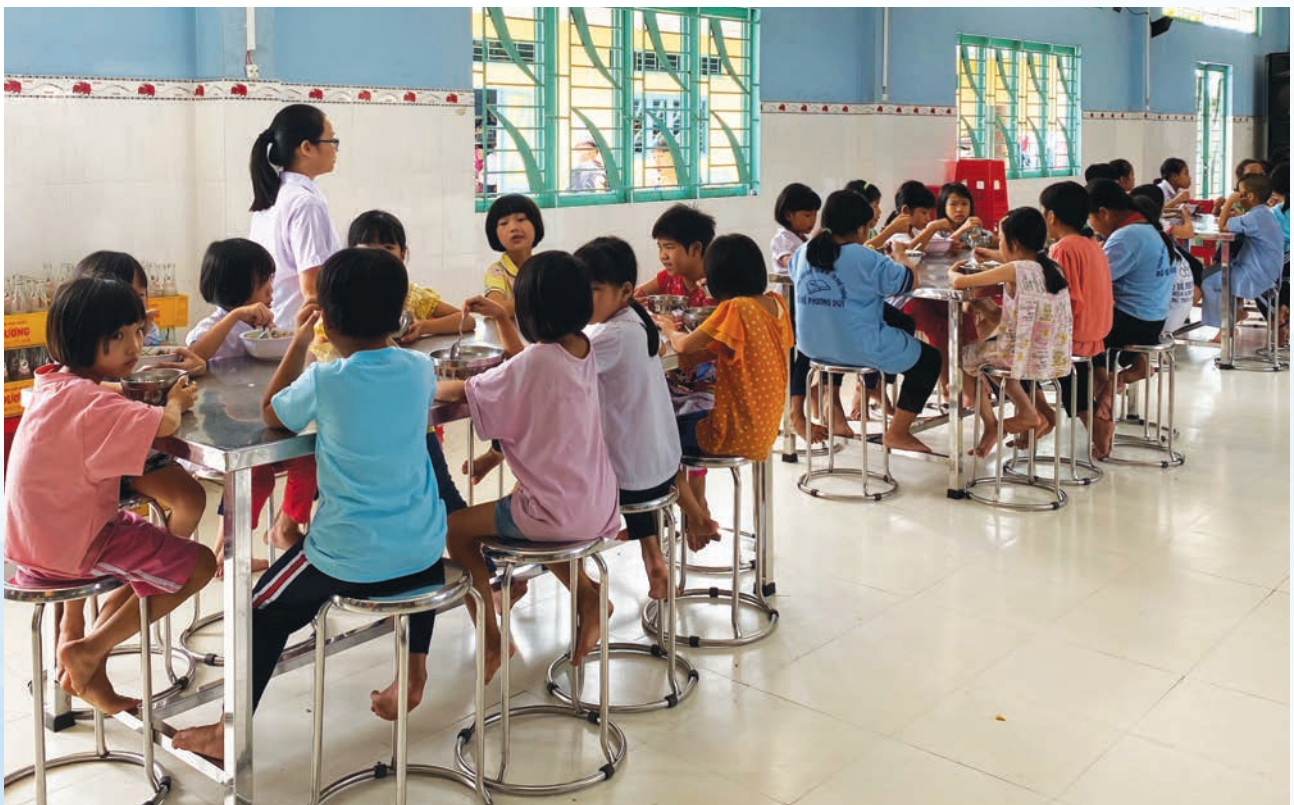
The Connection Unicorn team supports orphans