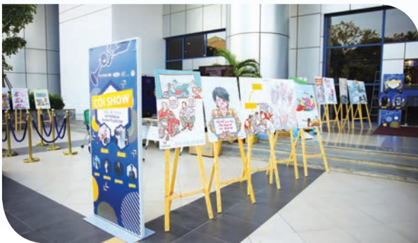
The Coi Show showcases photos that promote awareness for road safety in Vietnam

Leading carmaker Ford Vietnam has collaborated with local agencies and international organizations to help enhance road safety in Vietnam through many practical programs such as international seminars on road safety, helmet donations and driving skill courses over the past 12 years. Such a strenuous devotion over the long term has shown the automobile company's commitment to the community in a sphere of its strength.