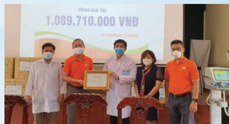
FPT representatives and Cu Chi Hospital in HCMC pose for a group photo at a donation handover ceremony in April this year