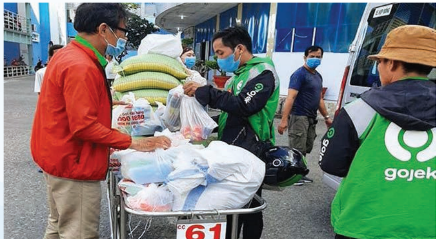
Gojek drivers donate gifts to needy people amid the coronavirus pandemic

The two women are among hundreds of newcomers to the GoFood platform since the coronavirus pandemic began in mid-March. They are owners of eateries and small food stores which had previously sold food in a traditional way, meaning that customers come to their eateries for meals and pay in cash. They did not know about the technology at all, or even never used a smartphone before. The GoFood platform of Gojek and smartphones have helped a number of food providers maintain their job and stabilize income.