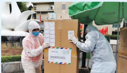
FPT employees handle a box of medical supplies donated to Bach Mai Hospital in Hanoi to fight Covid-19

A decade ago, Vietnamese tech giant FPT Corporation designated March 13 as its Community Day to encourage employees to take part in volunteer activities, to remind itself to always give back to the community alongside efforts to achieve business goals. This year, given that the coronavirus outbreak has upended all aspects of life, the tech firm took the initiative to accompany the Government, health care workers and local residents nationwide in the fight against the pandemic through a wide range of activities.