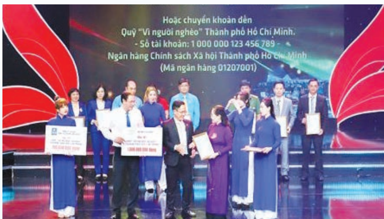
Novaland Group conducts practical activities for the community