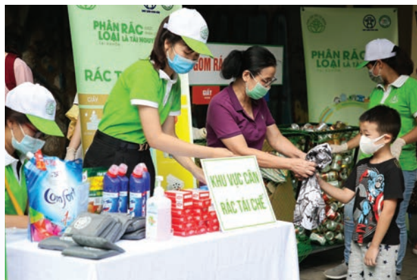
Residents exchange their plastic waste for products of Unilever

end up becoming waste in our environment.