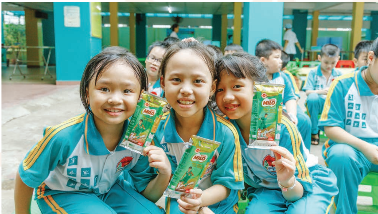
Vietnamese students holding Milo paper milk boxes pose for group photo