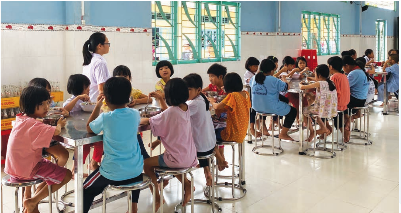
Kỳ Lân Kết Nối đến thăm các trẻ em mồ côi, cơ nhỡ trường Bồ Đề Phương Duy tại huyện Thủ Thừa tỉnh Long An.

S uốt nhiều năm qua, bên cạnh những thành tựu đạt được trong kinh doanh, Thăng Lợi Group vẫn luôn giữ vững vai trò, trọng trách với xã hội thông qua các hoạt động thiện nguyện vì cộng đồng. Chương trình “Trái tim người Thăng Lợi” được mở ra nhằm thực hiện các phong trào từ thiện với mục đích chia sẻ khó khăn, lan tỏa yêu thương đến xã hội.