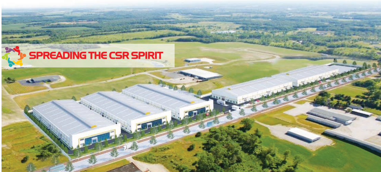
The Duy Tan Plastics Recycling Factory.