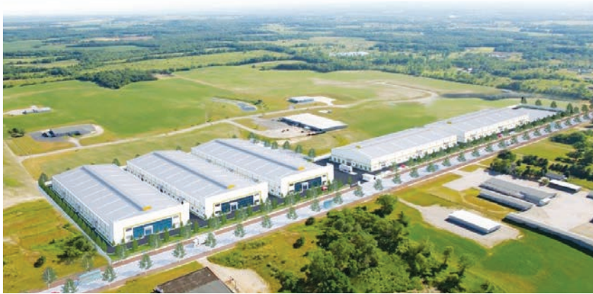
Nhà máy nhựa tái chế Duy Tân

Đồng hành cùng với chủ trương của Thủ tướng Chính phủ về tăng cường quản lý, tái sử dụng, tái chế, xử lý và giảm thiểu chất thải nhựa, Duy Tân đã đầu tư xây dựng nhà máy tái chế nhằm không chỉ mang lại lợi ích về kinh tế mà còn giúp cho môi trường sống thêm xanh