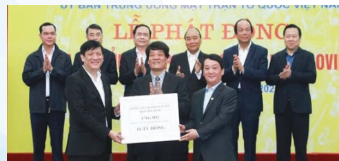
A representative of Thaco hands VND10 billion to the national fund on Covid-19 prevention and control

Từ thời điểm đại dịch Covid-19 bùng phát, Thaco đã liên tục hỗ trợ hoạt động phòng chống dịch. Là tập đoàn công nghiệp đa ngành được hàng triệu khách hàng tin tưởng, công ty Thaco đã luôn triển khai nhiều chương trình thực thi trách nhiệm xã hội” trong nhiều năm qua.