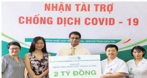
Representatives of Standard Chartered Vietnam donate VND2 billion to the National Hospital for Tropical Diseases