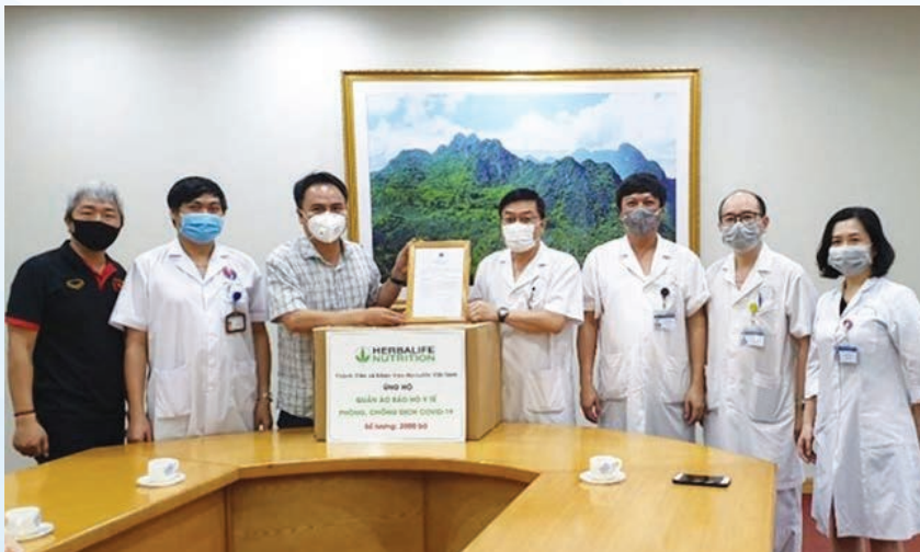
Representative of Herbalife Vietnam presents protective clothing to Friendship Hospital in Hanoi

Vietnam has won initial battles in the war against COVID-19, a highly contagious disease caused by the novel coronavirus, with no new cases found in the community for the past 26 days, no fatalities reported, and the number of active cases downsized to around two dozen only.