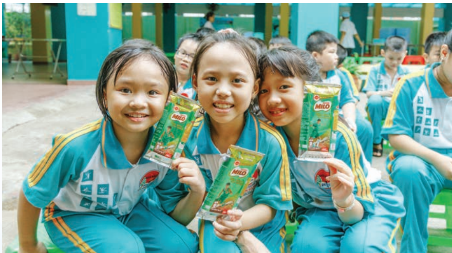
Các em học sinh tỏ ra thích thú với kiến thức tái sinh vô hộp

Với chiến lược kinh doanh cốt lõi mang tên “Tạo Giá Trị Chung” (Creating Shared Value-CSV), Công ty TNHH Nestlé Việt Nam đã duy trì hoạt động kinh doanh vượt qua cơn đại dịch Covid-19 cũng như tạo ra nhiều giá trị tích cực cho người tiêu dùng, nông dân, các đối tác và cộng sự tại Việt Nam.