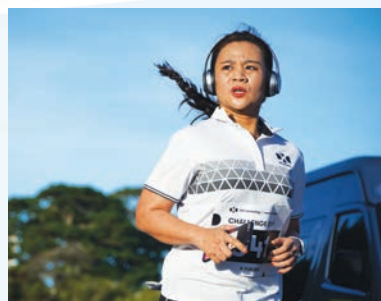
DXC Vietnam members join Fun Run for Charity event