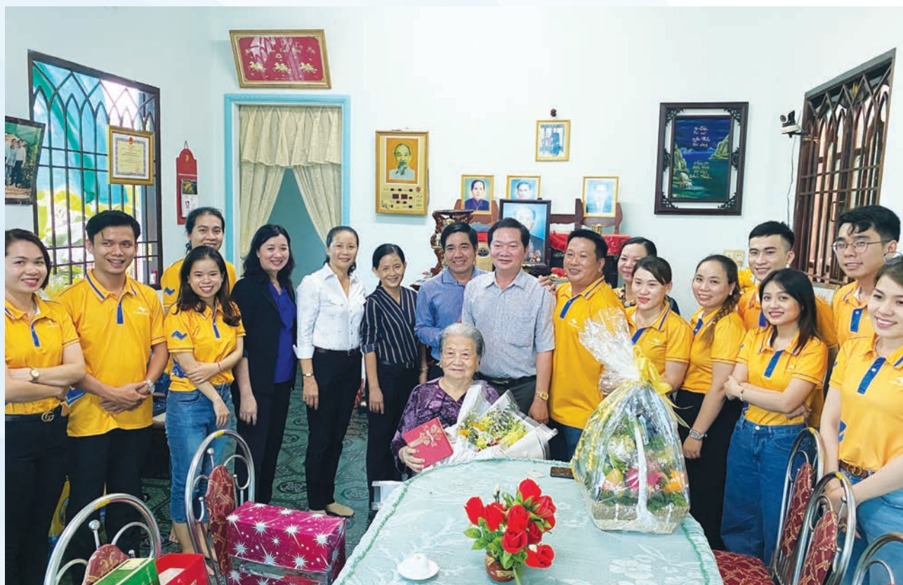
The Pioneer Unicorn team visits and supports a Vietnamese heroic mother

Over the past 10 years, apart from its remarkable achievements in business, the real estate corporation Thang Loi Group has been acting as one major contributor to the community through various social corporate responsibility (CSR) programs. On the occasion of its 10th anniversary on November 11, 2020, Thang Loi Group has organized the “Heart of Thang Loi” program in Long An Province to spread love and kindness to needy people.