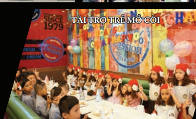
TÀI TRỢ TRẺ MÔ CÔI