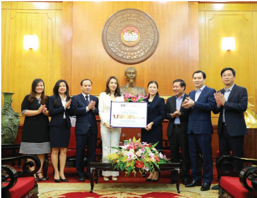
Chương trình 1 triệu ly sữa gửi tặng các lực lượng chống dịch COVID-19 trị giá hơn 8 tỷ đồng của Tập đoàn TH.

Coi trọng trách nhiệm xã hội doanh nghiệp (CSR), trong những năm qua, Tập đoàn TH đã có những đóng góp tích cực cho cộng đồng trên nhiều lĩnh vực: cam kết sản phẩm hoàn toàn từ thiên nhiên tốt cho sức khỏe, góp phần phát triển giáo dục, an sinh xã hội, bảo vệ môi trường và phát triển bền vững.