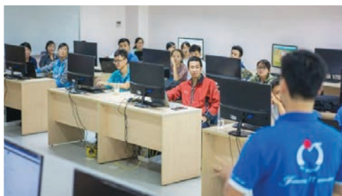
QTSC Foundation gives computer sets to representatives in Ca Mau Province