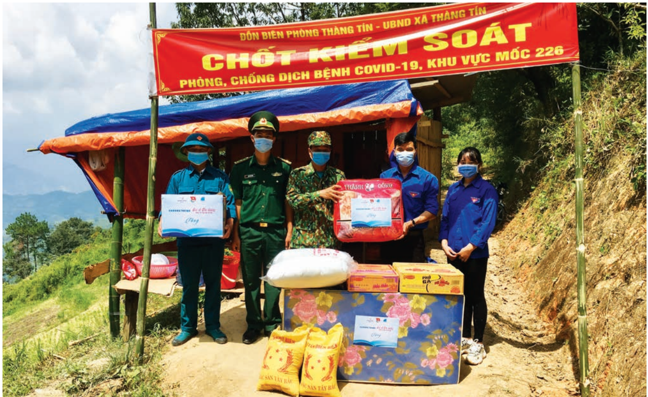
Representatives of Nam Long Group gift necessities to the border guard forces in Ha Giang Province

centers in the city, contributing to protecting doctors and medical workers in the combat against the pandemic.