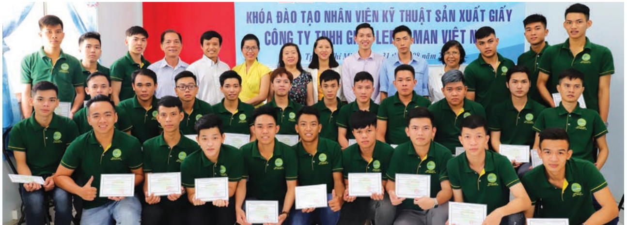
People pose for a group photo at a ceremony to wrap up a course providing training on paper manufacturing techniques, jointly organized by Lee&Man Vietnam and Nong Lam University in HCMC.

It is generally challenging for a company to achieve business development, mitigate negative impacts of its operations on the environment, and improve the quality of life for its employees and the local community at the same time. However, reality has shown that many companies have managed to thrive business without having to put social responsibilities on the back foot. Lee&Man Vietnam is one of such firms, having demonstrated its commitment to corporate social responsibility (CSR) initiatives by launching a wide range of programs showing its care to the society.