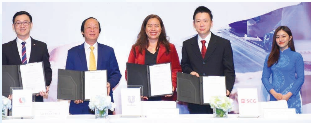
Early this year, Unilever Vietnam has joined hands with SCG, Dow and the Ministry of Natural Resources and Environment to form the first public private partnership to build the circular-economy model for plastics waste in Vietnam